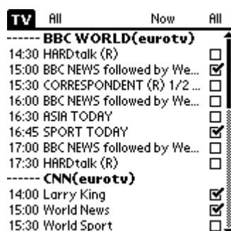
Рис.1 ATV - внешний вид

Для начала обратим внимание на внешний вид Zaval Advanced TV Guide – см Рис.1 ):