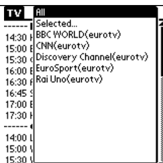
Рис.4 ATV – фильтр по каналам

Если необходимо просмотреть программы лишь для одного канала – тоже не проблема, применяем опять же фильтр по каналам – см. Рис.5 .