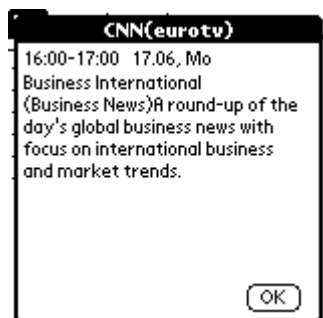
Рис.6 ATV – аннотация к программе

В некоторых газетах публикуют программу с краткими аннотациями к некоторым передачам. Аналогичная возможность предусмотрена и у нас – см. Рис.6 . Для просмотра аннотации достаточно кликнуть на выделенной передаче.