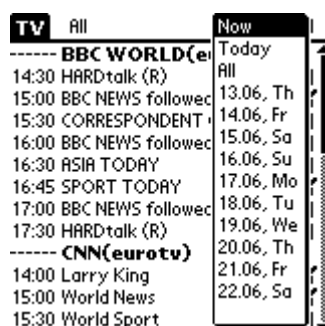
Рис.2 ATV – фильтр по времени

Допустим, нужно просмотреть только программы, которые идут прямо сейчас (на протяжении какого-то времени от текущего момента включительно). Для этого существует фильтр по времени (см. Рис.2 ). Аналогично можно просмотреть только программу на «сегодня» и т.д.