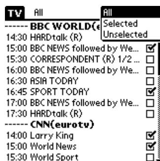
Рис.3 ATV – фильтр на основе выбора

Другой тип фильтров – это фильтры на основе выбора. Предположим, что, просмотрев программу, Вы выбрали (отметили галочками) интересные, на Ваш взгляд, передачи и теперь хотели бы видеть лишь список выбранных. Именно для этого и предназначен данный фильтр – см. Рис.3 .