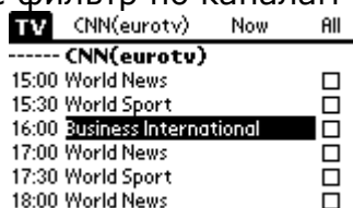
Рис.5 ATV – просматриваем программу на один канал

Если необходимо просмотреть программы лишь для одного канала – тоже не проблема, применяем опять же фильтр по каналам – см. Рис.5 .